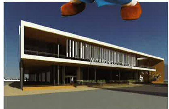
図書館イメージパース