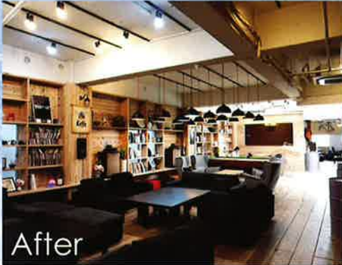
北九州市のリノベーション物件

タウンマネージャーが物件探しや出店に関するさまざまな相談に対応し、まちなかへの企業立地や新規出店をお手伝いします。