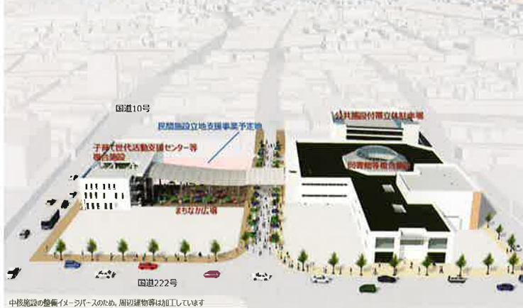
中核施設の整備イメージパースのため、周辺建物等は加工しています