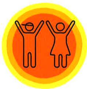
いい子どもが育つ都道府県

平均気温・全国第3位/日照時間・ 全国第3位/快晴日数・全国第2位