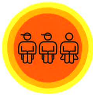
待機児童が少ない県