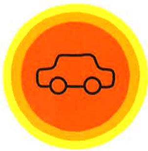
通勤・通学時間の短さ

待機児童数：0人(平成27年4月現在) 出典：厚生労働省 (保育所等関連状況とりまとめ)