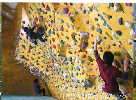
川原自然公園ボルダリング