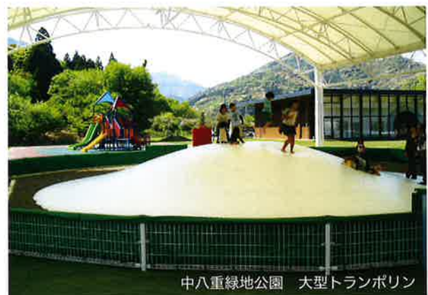
中八重緑地公園 大型トランポリン