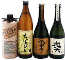
全国的にも人気の焼酎