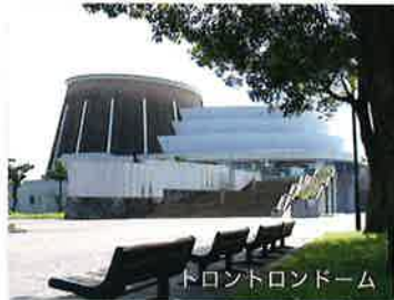
トロントロンドーム

温暖な気候と豊富な自然を活かした農業が盛んなほか、牛・豚・鶏、すべてが揃った畜産業も盛んです。また、漁港も有し、まさしく食の宝庫です。それら一次産業を活かした六次産業化や加工業も盛んで、宮崎県農協果汁（サンA）の工場や、鶏の処理加工等を行う児湯食鳥、サツマイモを活用したかりんとう（けんび）の製造会社があるほか、農産物の直売所や漁港にも直売所があり、新鮮な食材をご家庭で楽しんでいただけます。