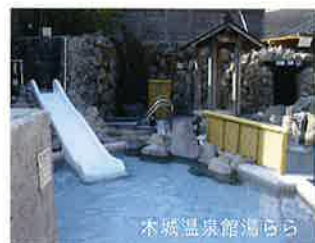
木城温泉館湯らら

山菜料理、山菜ビーコー、茶、漬物、焼酎、木城牛、木城豚、そば料理、ほおずき、柚子、柚子加工品、いちごロールケーキ、養生麺