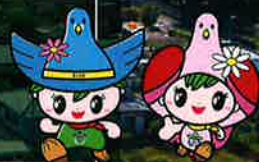
キックン クウちゃん

また、本町では定住支援施策、子育て支援施策の充実を図り小さくてもキラリと光る町づくりを行っています。