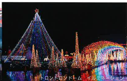
トロントロンドーム イルミネーション