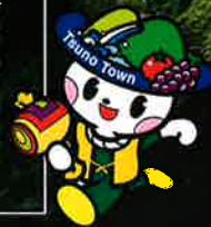
つ の び ゃ ん

2013年7月には国道10号線沿いに道の駅「つ」が完成し、2015年3月には東九州自動車道が全線開通するなど、交通網の利便性向上とともににぎわいの拠点を設け元気あるまちづくりを進めています。そのほか移住・定住に対する支援として、都農町では移住者の住宅取得に対する支援や、子育てに関する支援を行っています。