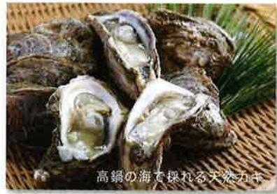
高鍋の海で採れる天然カキ