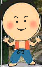
カリコボーズのホイホイ君

西米良村は、宮崎市の中心部から車で約2時間の熊本県境にある山深い谷あいの村です。人口は県内でもっとも少ない1,000人ほど。都会のような便利さはありませんが、豊かな自然、美味しい食べ物、美人の湯があります。なんと言っても一番の自慢は「心あったかな村の人々」です。小さな村だからこそできる子育てや教育、福祉などに優しい村づくりに取り組み、住んでいる人が全員「笑顔」になれるような村を目指しています。私達と一緒に幸せな村をつくっていただく仲間をお待ちしております。