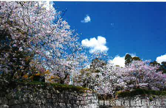
舞鶴公園(高鍋城址)の桜

高鍋町は「歴史と文教のまち」であり、長い歴史にはぐくまれた史跡や文化遺産が多くあります。貴重な動植物の宝庫である「高鍋湿原」や、昭和の農村風景を再現した「四季彩のむら」、県の宮崎観光遺産に指定された「高鍋大師」と「持田古墳群」などがあり、自然と歴史ロマンあふれるまちです！