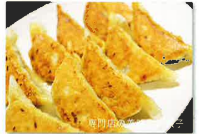
専門店が誇る餃子

日向灘の荒波にもまれた天然のカキ、広大な大地に実る白菜とキャベツ。旨みが詰まった餃子と焼酎。高鍋の特産物には知恵と経験、探究心がいっぱいです。