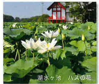
湖水ヶ池 ハスの花

ピーマン、きゅうり、トマト、エリザベスメロン、シンビジウム、そば、ちりめん、うなぎ（養鰻）、畜産（鶏卵、肉用牛）などが特産品です。