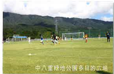
中八重緑地公園多目的広場