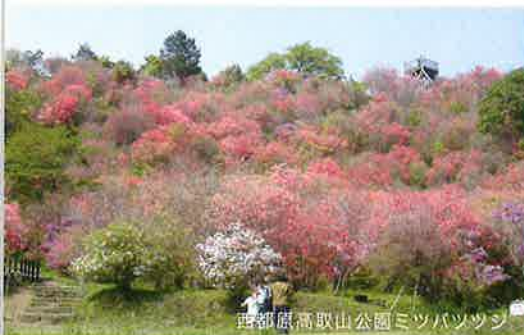
西都原高取山公園ミツバツツシ

西都市花まつり、西都夏まつり、西都古墳まつり、都於郡城址まつりの四大まつりをはじめとした各地域の祭や、銀鏡神楽や下水流日太鼓踊といった無形民俗文化財も数多くあります。また、野球やサッカーをはじめとした多くのプロ・アマチュアチームのスポーツキャンプ地としても知られています。